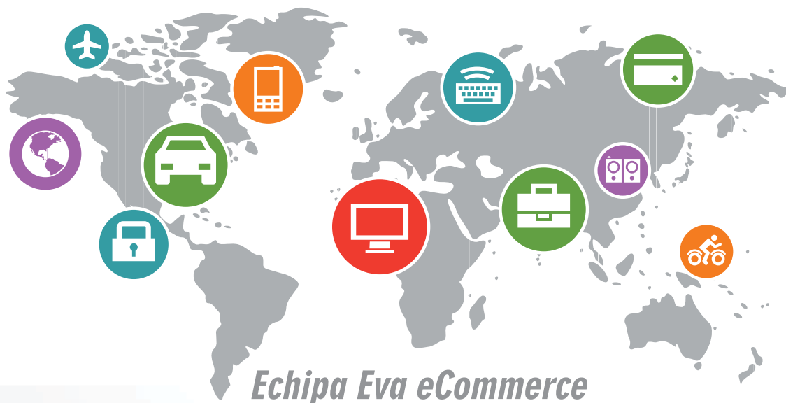
Echipa Eva eCommerce